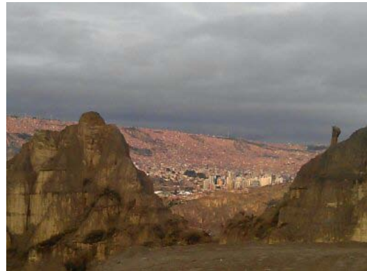
“El monstruo se hizo roca”.

Pero como poeta y escritor, junto con tal premio ganado bajo convocatoria de la Universidad Boliviana Técnica de Oruro; fue ganador también del Segundo Nacional de Cuento, convocado por la misma institución. Obtuvo además en 1986 una Medalla de oro en Poesía en el Concurso Nacional convocado por el Colegio Médico de Bolivia y fue Finalista en el Concurso “Franz Tamayo” de Cuento, 2003, La Paz. Fue además miembro activo de la Unión Nacional de Poetas y Escritores de Cochabamba.