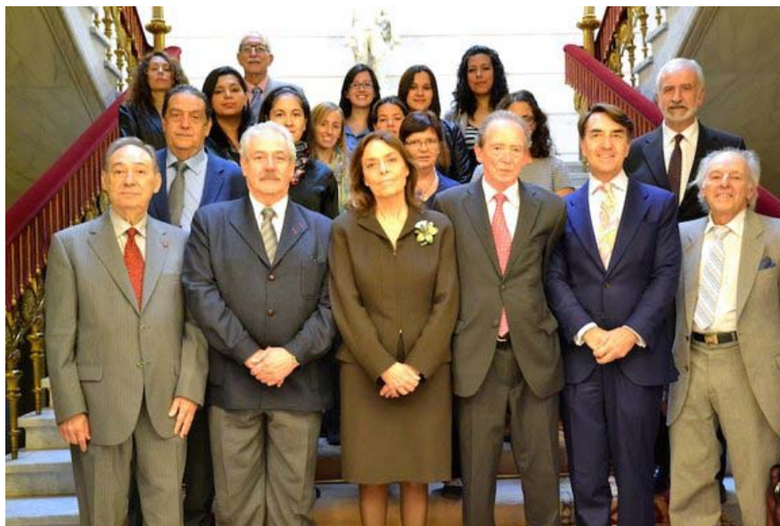
Académicos españoles y americanos con las alumnas del curso

Más información sobre el acto de inauguración y el Máster , en la página web de la ASALE.